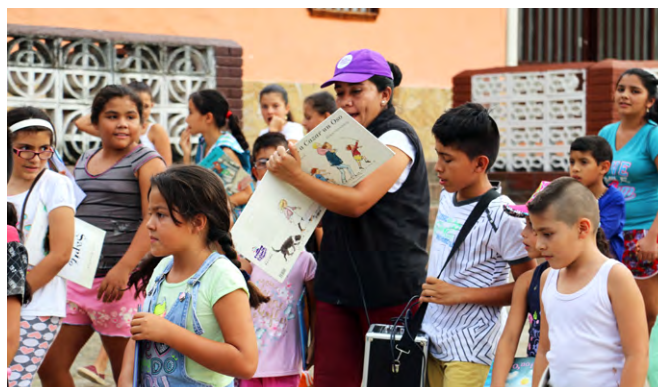
Servicios de extensión bibliotecaria, Biblioteca Pública Municipal de Chaguaní, Cundinamarca (2017)