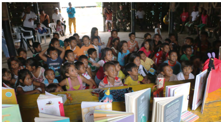
Programa «Escritores en las bibliotecas», Inírida, Guainía