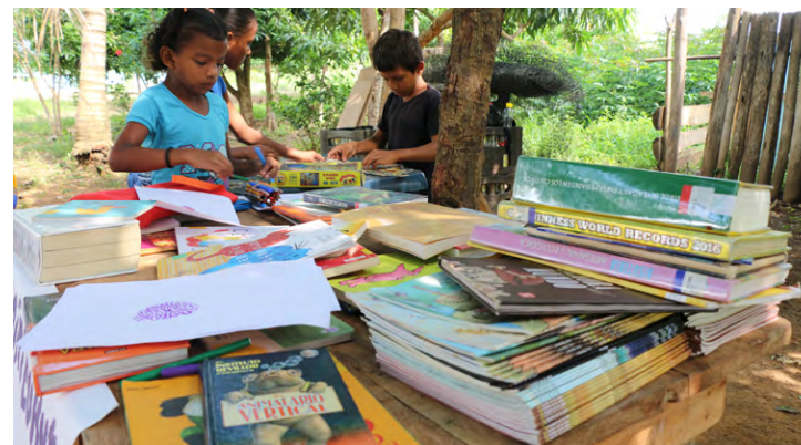
Biblioteca Pública Gallo, Tierralta, Córdoba