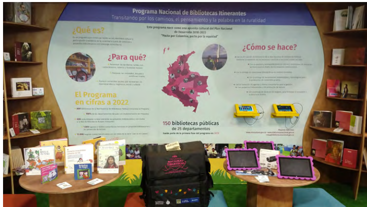
Programa Nacional de Bibliotecas Itinerantes, stand del Ministerio de Cultura en FILBo 2019