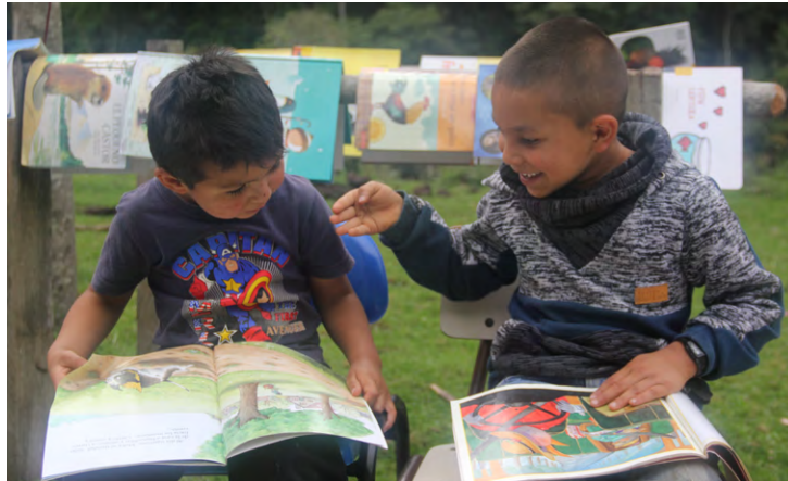
«Bibliotecas públicas por las veredas y los caminos de la paz», Planadas, Tolima (2018)