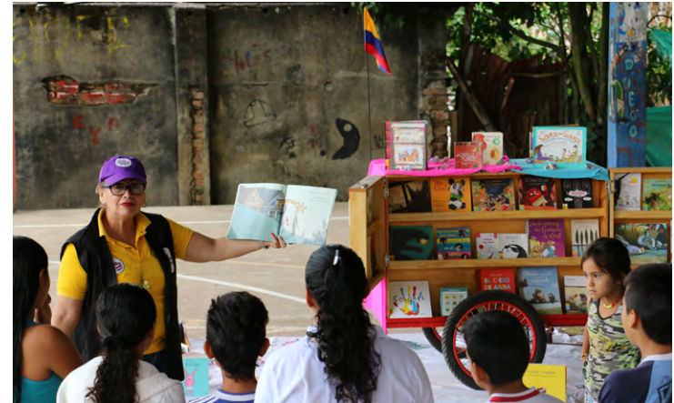
Programa de extensión bibliotecaria en el corregimiento El Limón, en Chaparral, Tolima