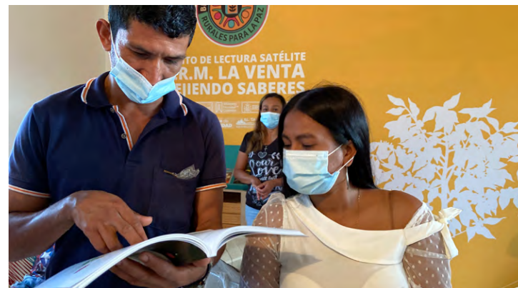
Inauguración de la «Biblioteca pública rural para la paz» Cuatro Esquinas, El Tambo, Cauca (2021)