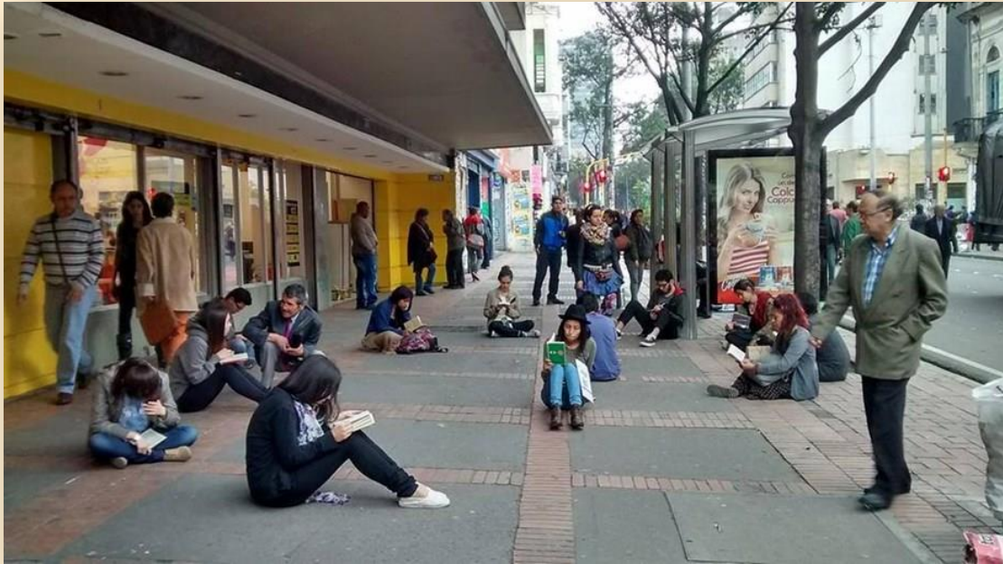
Segunda Jornada local AL AIRE LIBRO— Inicios de marzo de 2015