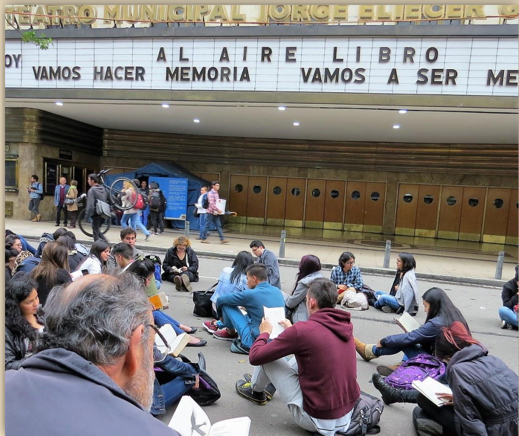
III Jornada Mundial AL AIRE LIBRO—Marzo de 2017