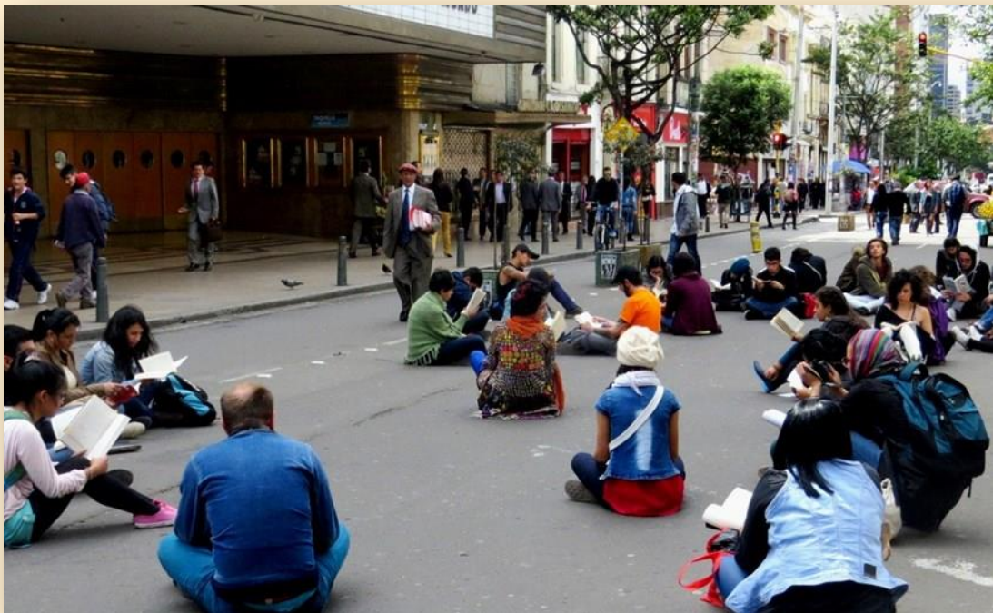
Cuarta Jornada local AL AIRE LIBRO Junio de 2015