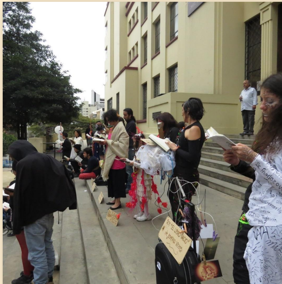
II Jornada Mundial AL AIRE LIBRO—Abril de 2016