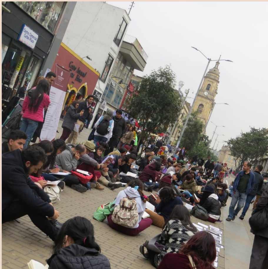
V Jornada Mundial AL AIRE LIBRO Marzo de 2019