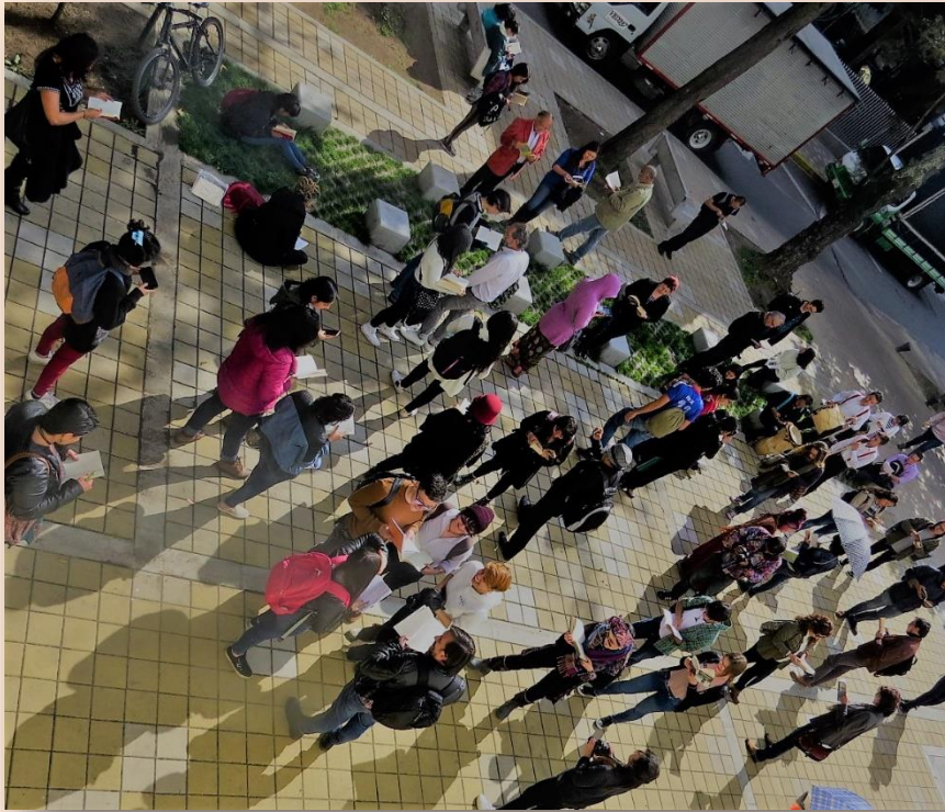
IV Jornada Mundial AL AIRE LIBRO Marzo de 2018